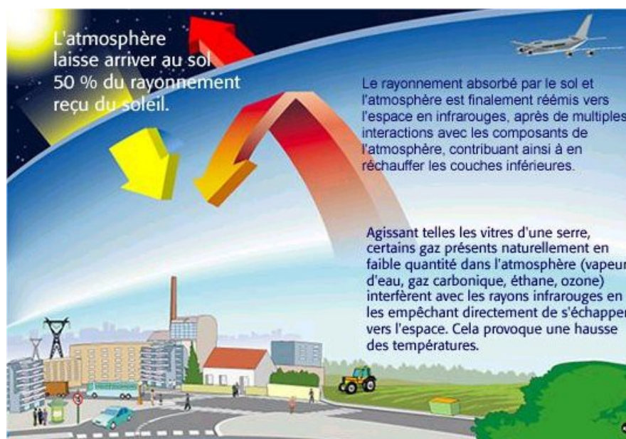
■ Figure 2 : Schéma simplifié de l'effet de serre (MIES – Mission Interministérielle de l'Effet de Serre)

au traitement des déchets et à certains procédés industriels, créent un effet de serre additionnel qui dérègle le climat .